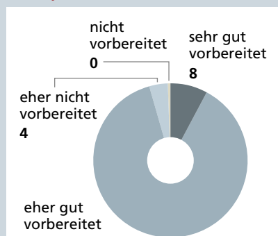
Abbildung 2: Vorbereitungsstand auf Cyberrisiken (in Prozent)